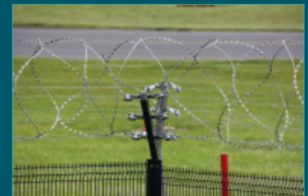
أنظمة السياج الأمني