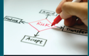
تقييم المخاطر الأمنية ونقاط القوة والضعف