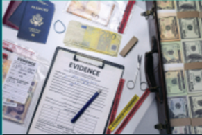
دراسة القضايا الأمنية بأنواعها