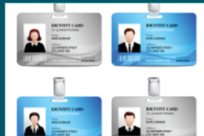
بطاقات التحقق من الهوية الشخصية