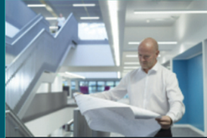
إعداد التصاميم الأمنية