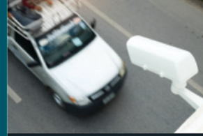
تقديم استشارات مرورية