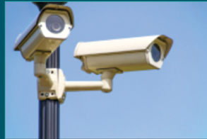
أنظمة المراقبة الأمنية وكاميرات المراقبة