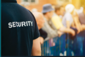
تقديم خدمات التدريب التخصصي الأمني