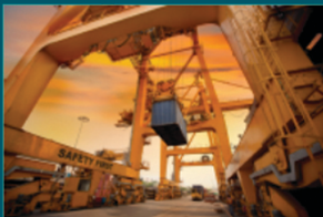
مرافق الواجهات البحرية