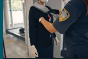
خدمات المسح الأمني