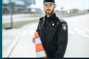
إعداد السياسات والإجراءات الأمنية