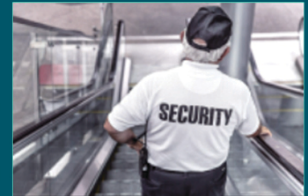
إدارة الأمن في المنشآت الصناعية