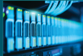
شبكات البيانات والاتصالات الأمنية